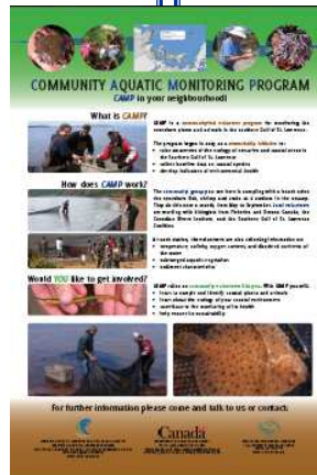
CAMP Portable Signs / Affiche portable PSCA

It has been a busy year for CAMP. We are happy to have achieved all the goals set early last year, despite a lack of funding for the community groups. This work would not have occurred without the tremendous support and willingness of these groups, and the partnership of the Gulf Fisheries Center and the Atlantic Ecosystem Initiative. Since CAMP is at such a crucial time and has had such a phenomenal year, the Annual General Meeting on June 12 will have a whole section devoted to the review of CAMP data and the next steps. We invite all CAMP groups and volunteers to attend the AGM and take this opportunity to be informed and inform others on the future of the program.